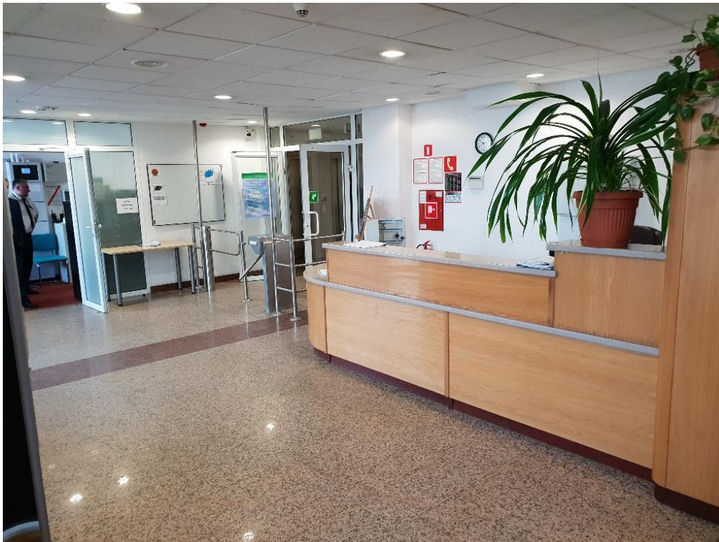
Rys. 2 Recepcja widok ogólny

Budynek zbudowano w konstrukcji szkieletowej żelbetowej z prefabrykowanych ram i słupów oraz stropów gęstożebrowych Ackermana. Słupy konstrukcyjne rozstawione są w odległościach 6 m i 3 m tworząc moduły mieszczące pokoje biurowe korytarze, klatki schodowe, szyby windowe oraz piony sanitarne. Ściany nośne wewnętrzne trzonów windowych i klatek schodowych wykonano w technologii monolitycznej żelbetowej. Budynek poza maszynownią przykryty jest stropodachem żelbetowym z pustką powietrzną.